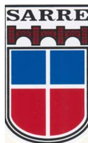
Landesbibliothek des Saarlandes