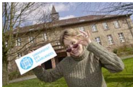
Universitätsbibliothek der Universität des Saarlandes